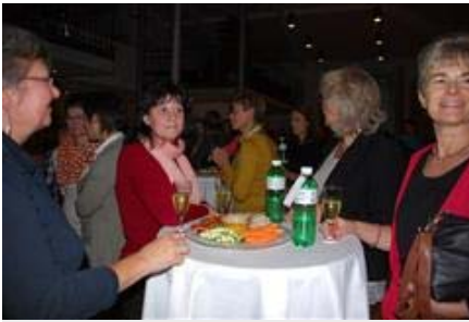
Viele Frauen treffen sich regelmässig am Frauenanlass.

etwas sagen.» Deshalb rät sie den Frauen auch, sich abzugrenzen und die eigenen Grenzen zu schützen. «Das Nein gehört unbedingt zu ihrem Wortschatz.»